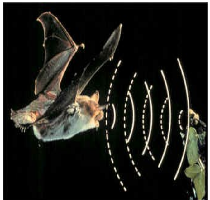
Les chauves-souris repèrent leurs proies et les obstacles dans l'obscurité grâce à l'écholocation.

Ce système physiquement parfait d'écholocation, ainsi qu'une excellente mémoire des lieux, donnent à la chauve-souris une image « acoustique » très précise de son environnement.