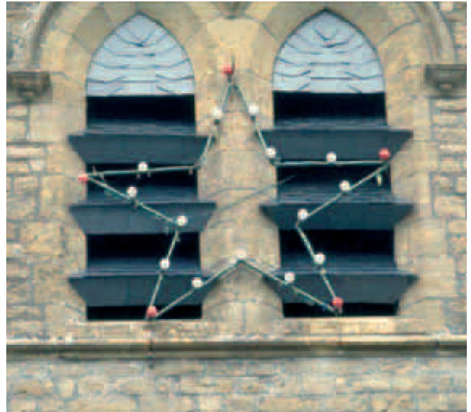
Le placement de luminaires de Noël à l'emplacement des entrées des refuges des chauves-souris est à éviter ou alors être étudié avec soin.

Cet éclairage, s'il est mal pensé, risque de devenir un obstacle majeur à la colonisation par les chauves-souris, celles-ci n'osant sortir ou entrer dans une lumière intense. Il est donc important de laisser un côté de l'édifice dans l'ombre, au moins la partie présentant les accès, ou créer les ouvertures dans la zone non éclairée. Quoique le plus simple et la meilleure solution serait de ne pas éclairer l'église ou à tout le moins de ne pas éclairer l'entièreté de la nuit. Surtout si elle ne