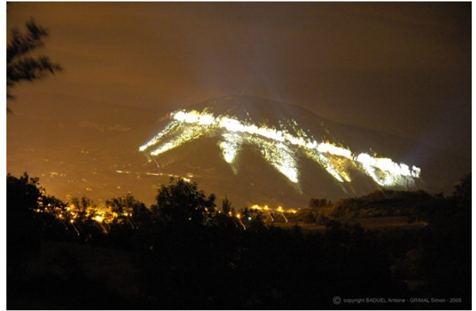
Eclairer les falaises où se trouvent des grottes chasse les chauves-souris de leurs habitats.

« C'est probablement en raison de leurs difficultés à éviter les prédateurs que les chauves-souris sont des animaux nocturnes » explique le professeur Jones. Les chercheurs ont installé des lumières artificielles le long de huit routes emprun-