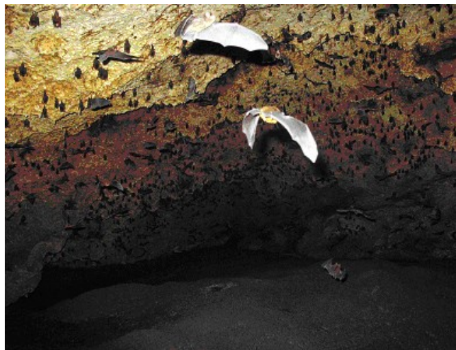
Les grottes sont aussi des lieux d'habitat adoptés par les chauves-souris.

Seule une nurserie découverte permet de faire un recensement intéressant.