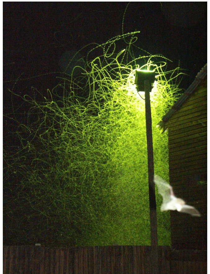
Les lumières attirent les insectes, ce qui peut paraître un avantage pour les chauves-souris, mais constituera à terme un handicap par la disparition trop rapide des proies

Les sources lumineuses blanches aident certaines espèces de chauves-souris à trouver leurs proies la nuit, mais les insectes attirés par la lumière ont un comportement perturbé (recherche de nourriture, reproduction) ce qui conduit à moyen terme à leur disparition locale et par là-même à une diminution des ressources nutritives des chauves-souris. Les lampes à forte proportion d'ultra-violet devraient pour bien faire être remplacées par d'autres plus faibles en UV, mais ce n'est pas vers ce choix que l'éclairage public se dirige, puisqu'il privilégie les LED « blanches ».