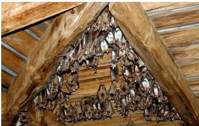
Les charpentes, que l'on peut trouver par exemple dans les combles et les clochers, constituent des habitats courants pour les chauves-souris.

Les cavités souterraines : grottes, anciennes carrières, caves, souterrains, tunnels... Durant l'hiver, c'est le lieu d'hibernation d'une majorité d'espèces, et en particulier des cavernicoles : les trois espèces de Rhinolophes, le Grand Murin, le Murin à Moustaches, le Minioptère... D'autres espèces y passent ou y séjournent plus ou moins longtemps. Ces cavités souterraines ont pour la plupart une température trop basse pour la reproduction.