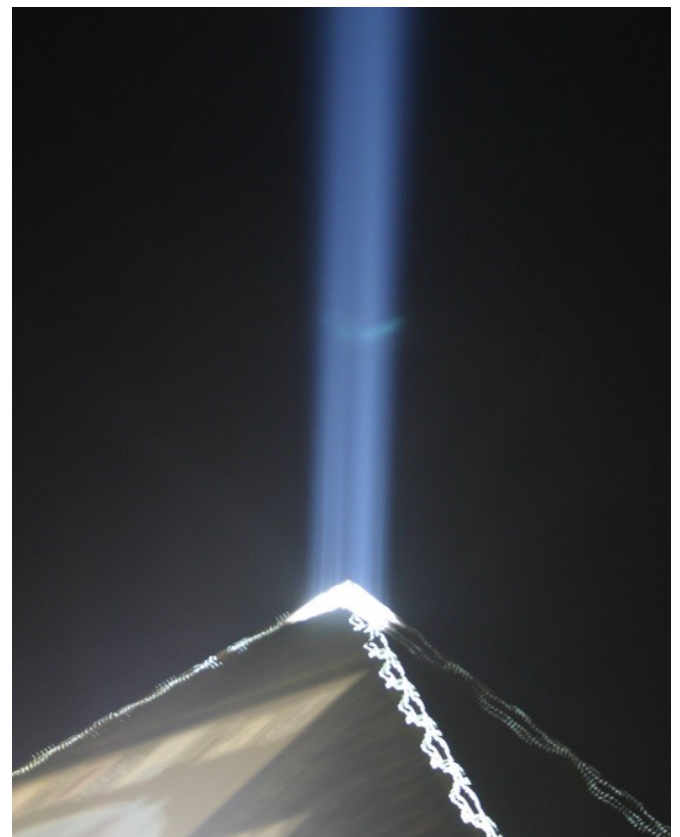
Eclairage abusif : plus futile qu'utile !