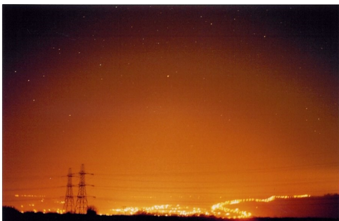
Un exemple typique de halo lumineux

main et l'environnement : éblouissement qui porte atteinte à la sécurité, lumière intrusive qui ne respecte pas notre vie privée et qui peut entraîner des troubles du sommeil, perte de vision de notre Univers et impact culturel que cela sous-entend. Mais il y a surtout les effets négatifs sur l'Environnement, allant de la simple gêne apportée à la vie nocturne aux atteintes et donc aux pertes de population de certaines espèces animales comme des oiseaux migrateurs, des tortues marines, des amphibiens ou des insectes et papillons de nuit qui disparaissent par milliards chaque année.