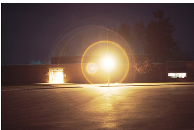
Un éclairage éblouissant n'améliore sûrement pas la sécurité