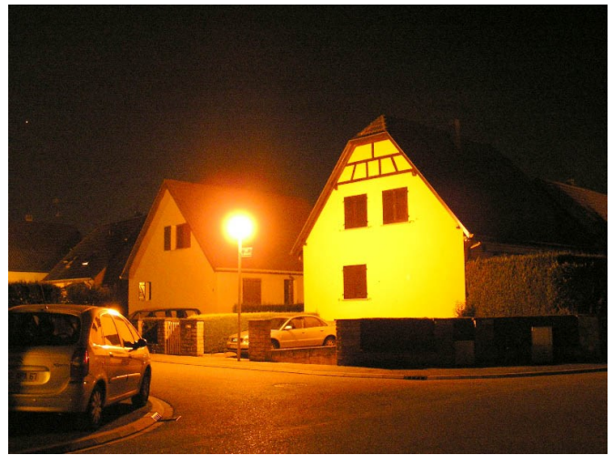
La lumière intrusive est une atteinte à la vie privée

Mais il en existe d'autres qui impactent l'être hu-