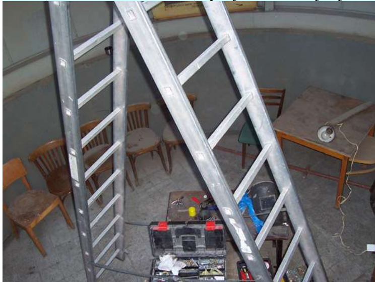
Obr. 06 – Oprava funkčnosti kopule.

navyknou a můžeme tak vidět co v kupoli zbylo. Moc toho není, pár židlí, stoly, elektro motor na otáčení kopule, středová, betonová krychle, kdysi nesoucí dalekohled, nyní prázdná. Nicméně i toto mě stačilo k radosti a už jsem viděl ty plány. To už jsme ale zase sestoupili dolů, kde nám kastelánka ukázala, co zbylo z bohaté knihovny – pár potrhaných a špinavých svazků knih, které místní výrostci nestačili spálit, když se do hvězdárny dostali a založili si uprostřed oheň. Na další průzkum už nebyl čas a tak za námi zase zámky cvakli a šlo se do zámku, na obhlídku místností, nyní již mimo můj zájem.