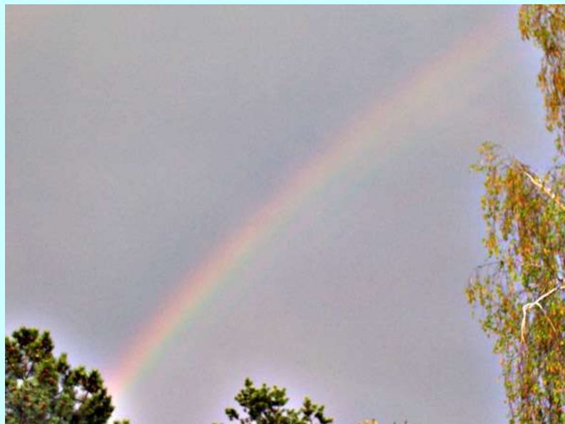
První letošní duha, 25.4.2006. Lehce upraveno v Photoshopu.