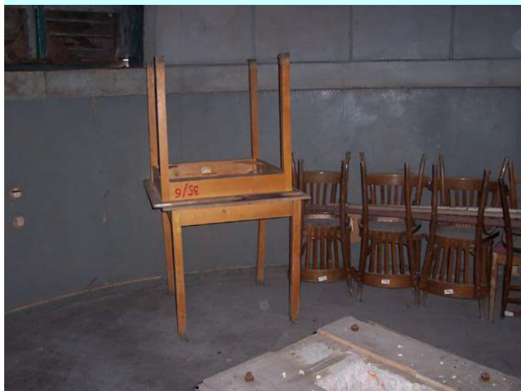
Obr. 04 - Pohled do kopule po první návštěvě.

V minulém čísle Parhelia jsem upozornil na Holešovskou hvězdárnu a že o ní napíši delší povídání a svůj slib plním. Protože se již 11 let zajímám o astronomii, vždy mě naše hvězdárna lákala a doufal jsem, že se někdo najde, kdo ji obnoví a konečně se to zde trochu hne kupředu. Bohužel po celá léta se nic nedělo a tak jsem vzal iniciativu do vlastních rukou. Celý příběh začal asi před dvěma roky, když holešovský zámek a s ním i hvězdárna, patřil ještě do soukromého vlastnictví. Zašel jsem tedy za majitelem a zeptal se, co hodlá s hvězdárnou učinit. Nabídl jsem taky svou pomoc při obnově. Majitel mi ale sdělil, že se chystají do měsíce celý zámecký komplex prodat, takže by moje práce mohla být zbytečná, protože se neví, co nový vlastník s hvězdárnou udělá. Nezbyvalo mi nic jiného, než čekat.