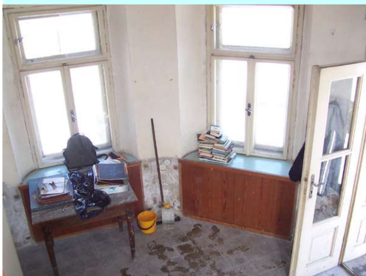
Obr. 05 – Přizemí hvězdárny před úklidem.

než jsem byl pozvaný na další schůzku, tentokrát už s procházkou na hvězdárnu.