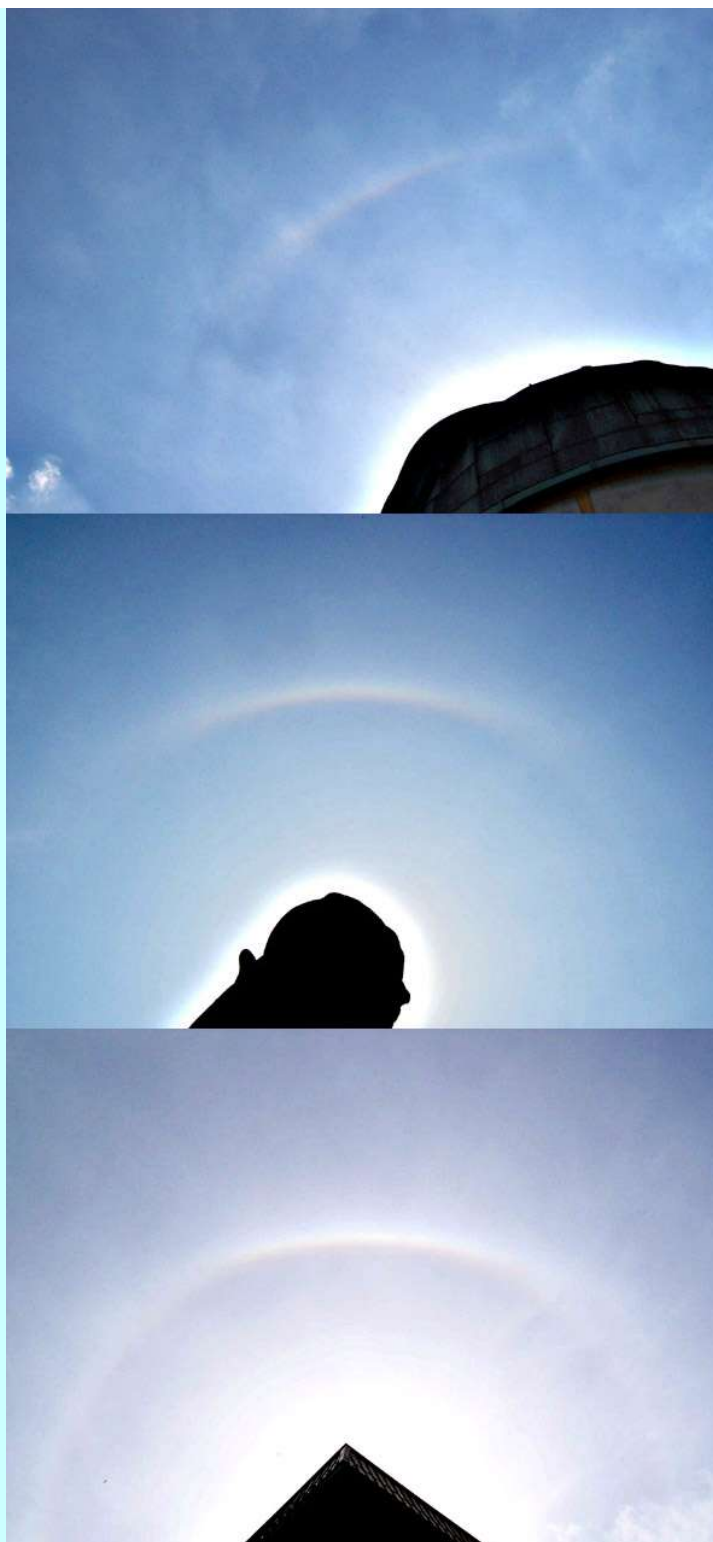
Obr. 02 – horní dotykové oblouky v Holešově, nahoře 15.4.2006, uprostřed 20.4.2006 a dole 2.5.2006. Všechny snímky upraveny v Photoshopu. První dva snímky jsou pořízeny u hvězdárny, spodní je již vyfocen na letišti.