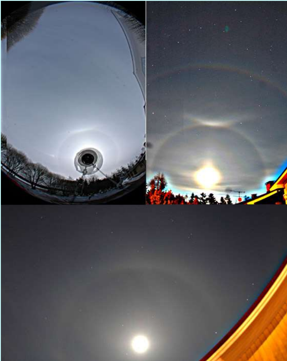
Nahoře vlevo: malé halo, horní dotykový oblouk, parhelia, parhelický kruh 13.4.2006. Nahoře vpravo: malé halo, horní dotykový oblouk a supralaterální oblouk u Měsíce 12.4.2006. Dole: malé halo a horní dotykový oblouk u Měsíce 8.4.2006.